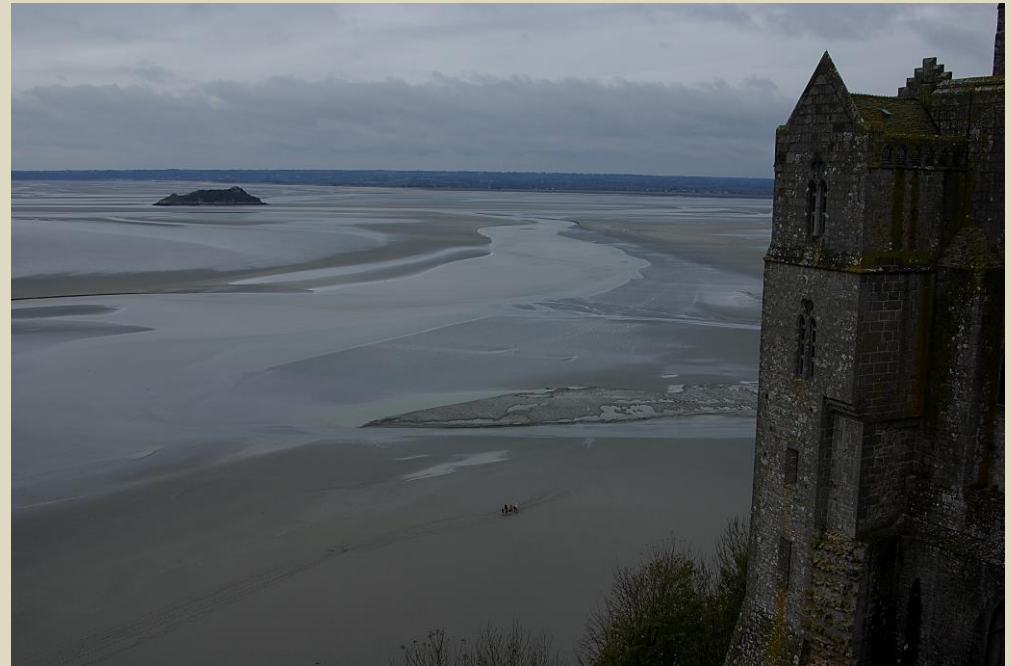
Point de vue de la terrasse de l'église abbatiale