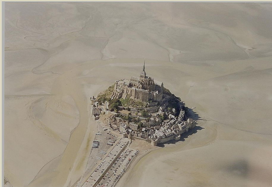
Vue aérienne du mont Saint-Michel

L' origine du sanctuaire vient de l'apparition de l'archange saint Michel qu'aurait eue l'évêque d'Avranches, Aubert, vers 708, lui ordonnant d'établir un oratoire sur l'îlot du Mont-Tombe. Saint Michel a une grande importance au Moyen Age. Il apparaît dans le Nouveau Testament comme le combattant et le vainqueur d'un dragon, symbole du démon. C'est le patron des chevaliers et de tous les corps de métiers liés aux armes et aux balances.