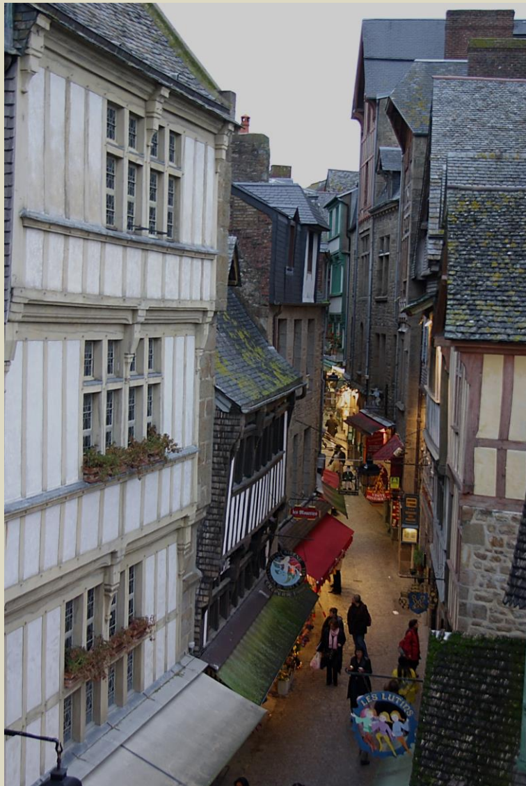
Rue principale du mont bordée de maisons à pans de bois

Au X ème siècle, les bénédictins vinrent s'installer à l'abbaye. Un village se construisit en contrebas de celle-ci.