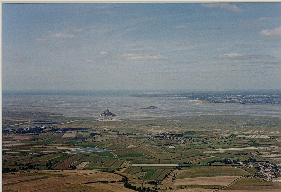
Baie du mont Saint-Michel

L e mont Saint-Michel se dresse dans le pays de la baie du mont Saint-Michel . C'est l'une des principales curiosités monumentales et pittoresques de la France, laisse aux visiteurs un souvenir impérissable.