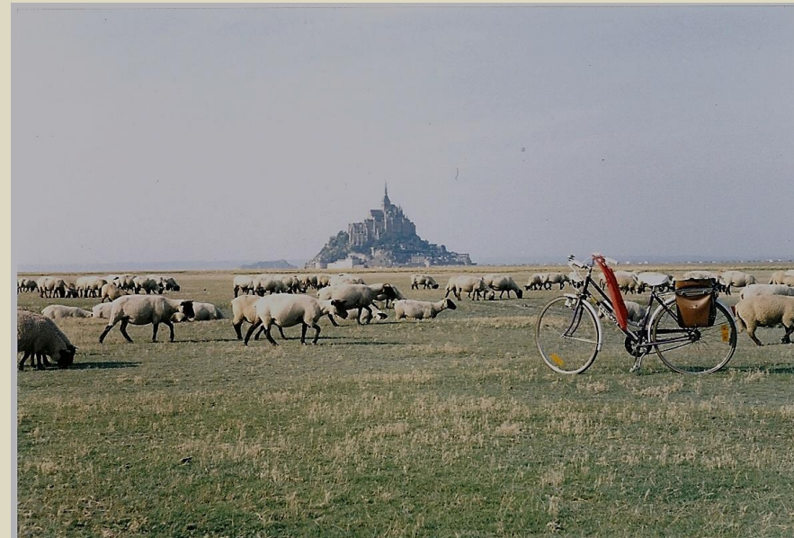
Moutons des prés salés