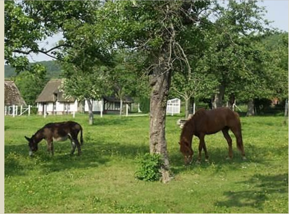
Une des nombreuses chaumières du site au printemps

L'habitat est caractéristique en forme de village rue. Au milieu des pommiers, les chaumières perpendiculaires ou parallèles en pente possèdent ou non une cave semi enterrée appelée "cafoutin".