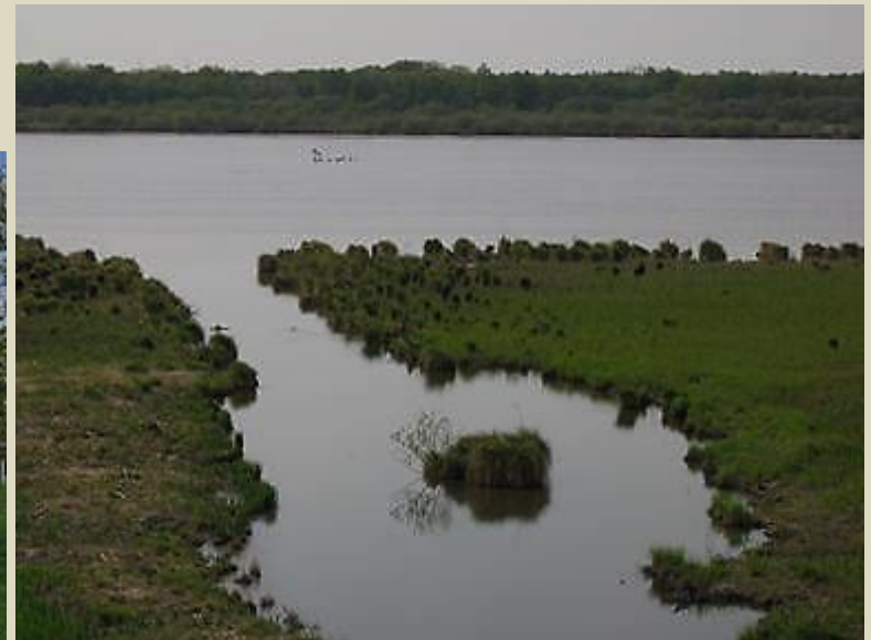
Ci-dessus, vue du site de l'ancien gabion