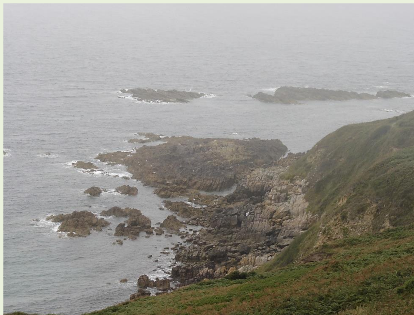
La côte déchiquetée un jour de pluie et de brouillard