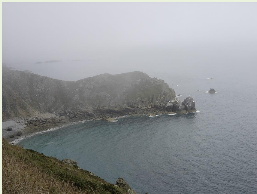
Le Nez de Jobourg

A u cœur du site « Natura 2000 », les falaises granitiques du Nez de Jobourg , d'une hauteur de 128 mètres d'à-pic, sont réputées parmi les plus hautes d'Europe. Elles permettent de profiter de nombreux points de vue sur les îles Anglo-Normandes . C'est également un lieu de nidification privilégié pour des espèces variées d'oiseaux, à savoir le faucon pèlerin, le cormoran huppé, le fulmar boréal, et le grand corbeau.