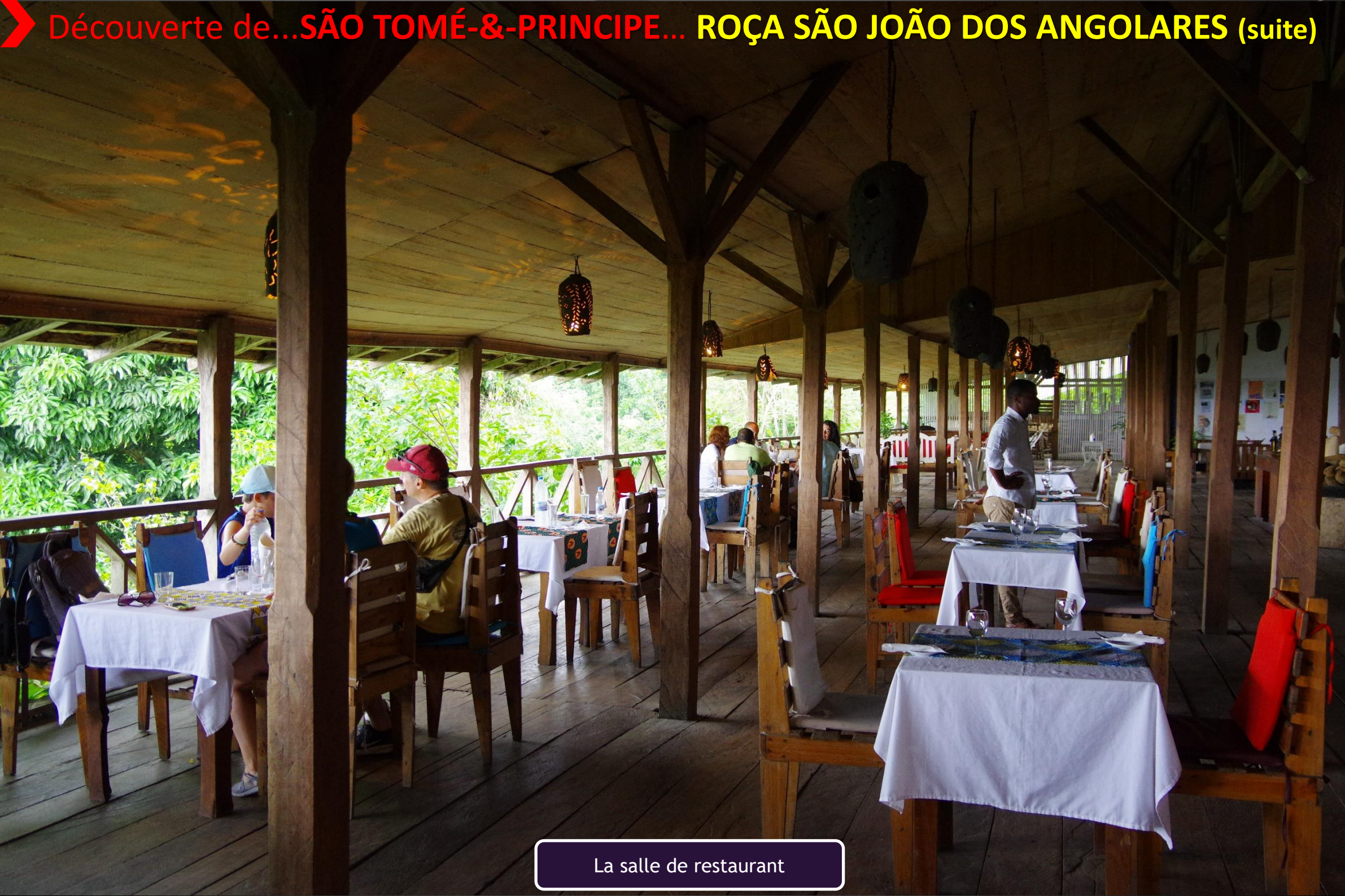
La salle de restaurant