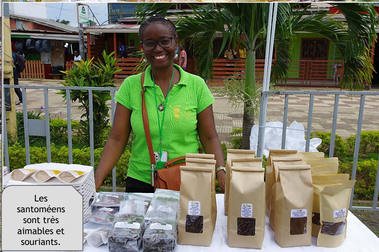
Les santoméens sont très aimables et souriants.