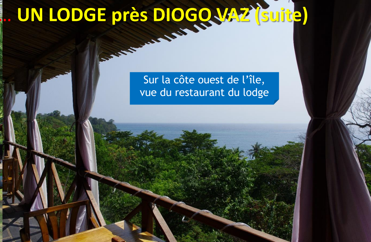
Sur la côte ouest de l'île, vue du restaurant du lodge