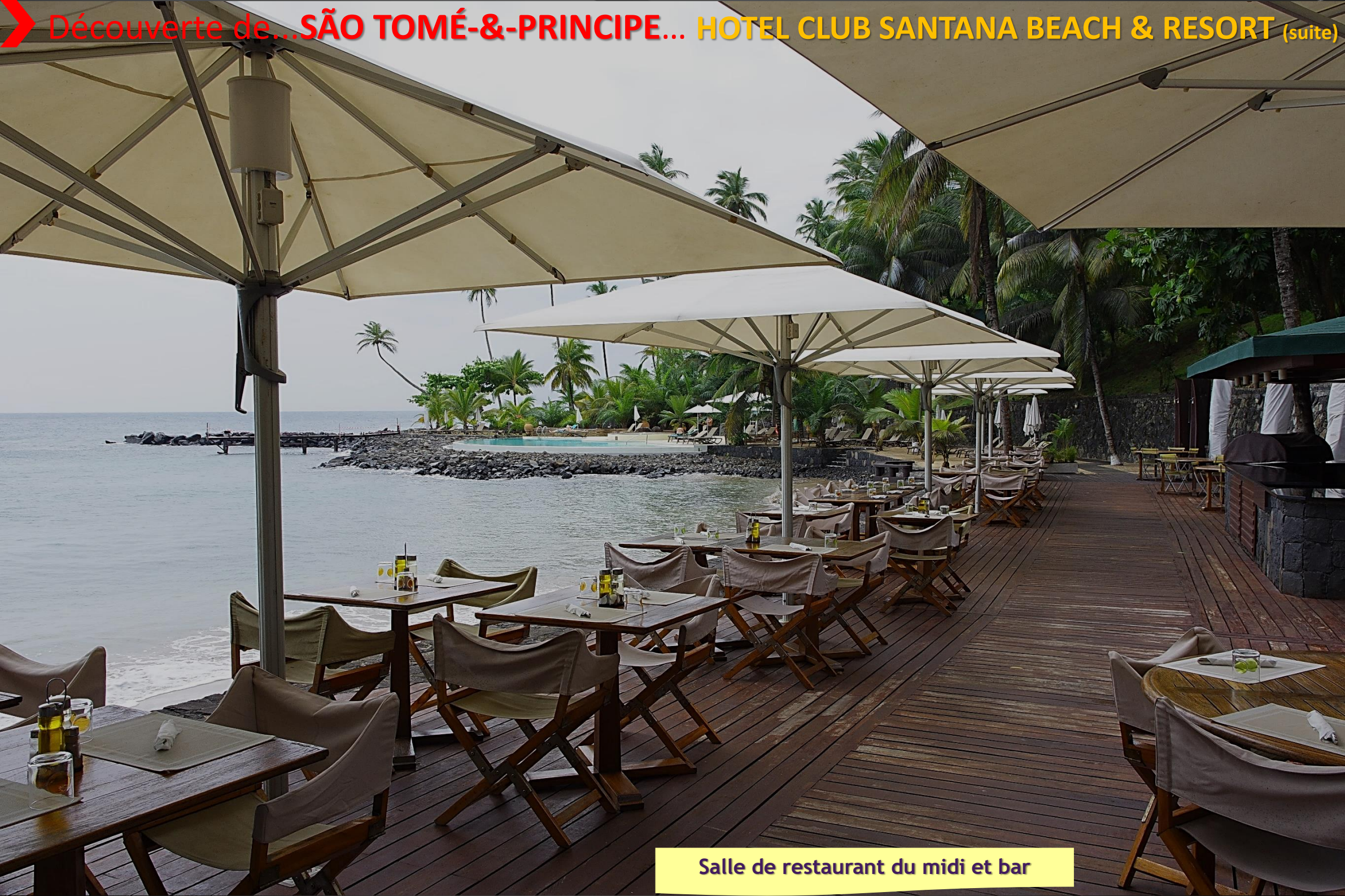
Salle de restaurant du midi et bar