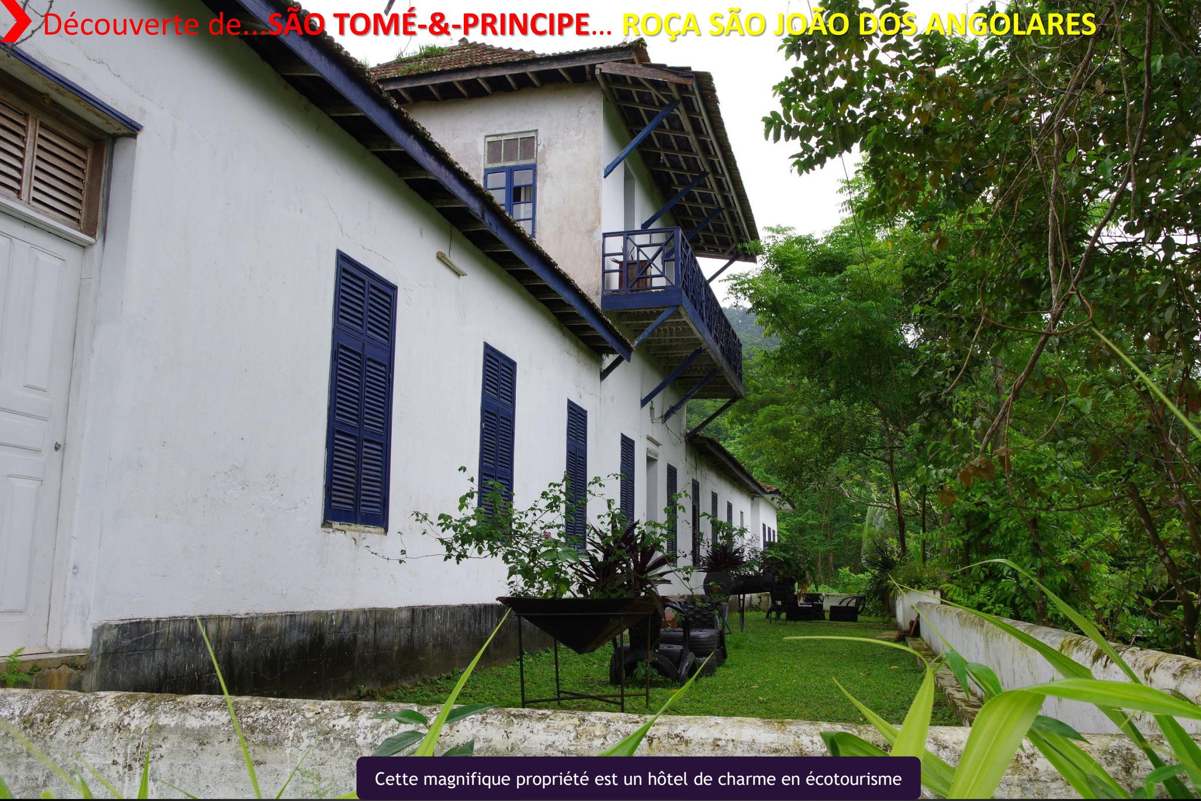
Cette magnifique propriété est un hôtel de charme en écotourisme