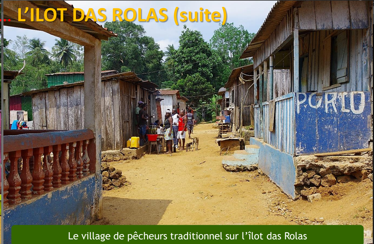
Le village de pêcheurs traditionnel sur l'îlot das Rolas