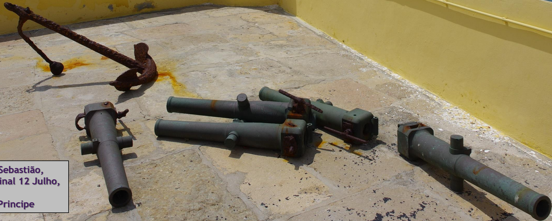
Forte de São Sebastião, Avenida Marginal 12 Julho, São Tomé, Sao Tomé-et-Principe