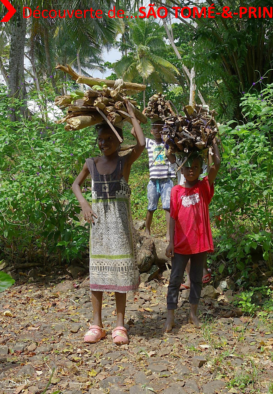
Les enfants sont chargés de ramasser du bois.

L'archipel de São Tomé-et-Principe, mérite d'être découvert, et ce malgré le coût élevé du voyage et du séjour.