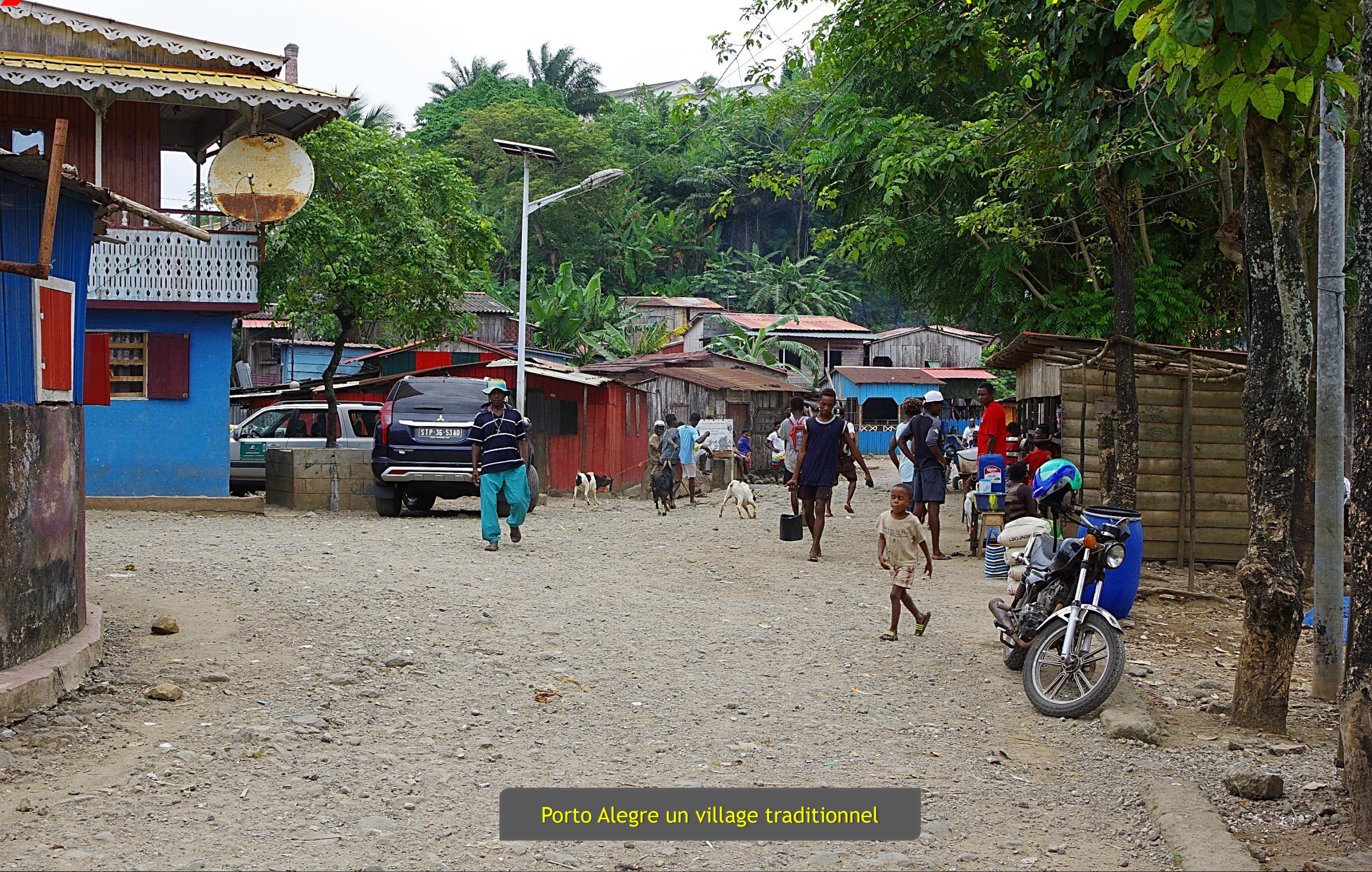
Porto Alegre un village traditionnel