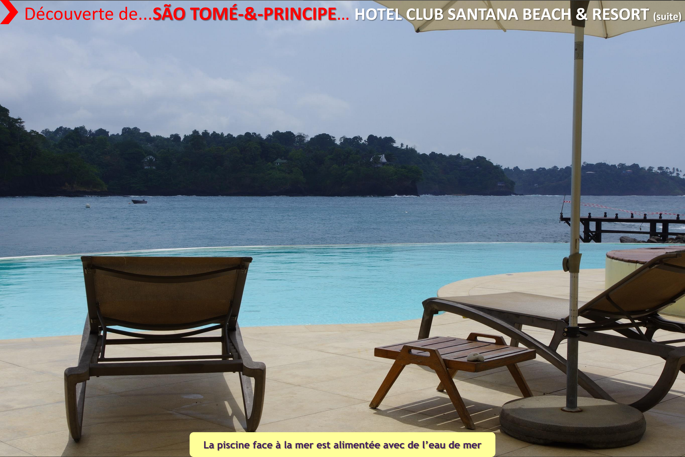
La piscine face à la mer est alimentée avec de l'eau de mer