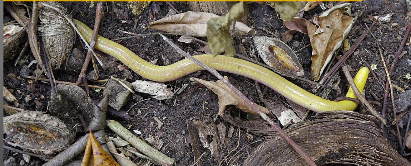
Ce cobra jaune sur l'île de São Tomé ne mord pas, mais ne pas le prendre. A ne pas confondre avec le cobra noir qui est dangereux

Cependant, il y a encore beaucoup de chemin à parcourir pour que ce soit une destination touristique réputée (routes à refaire, restaurer les anciennes propriétés rurales qui sont à l'abandon, par exemple...)