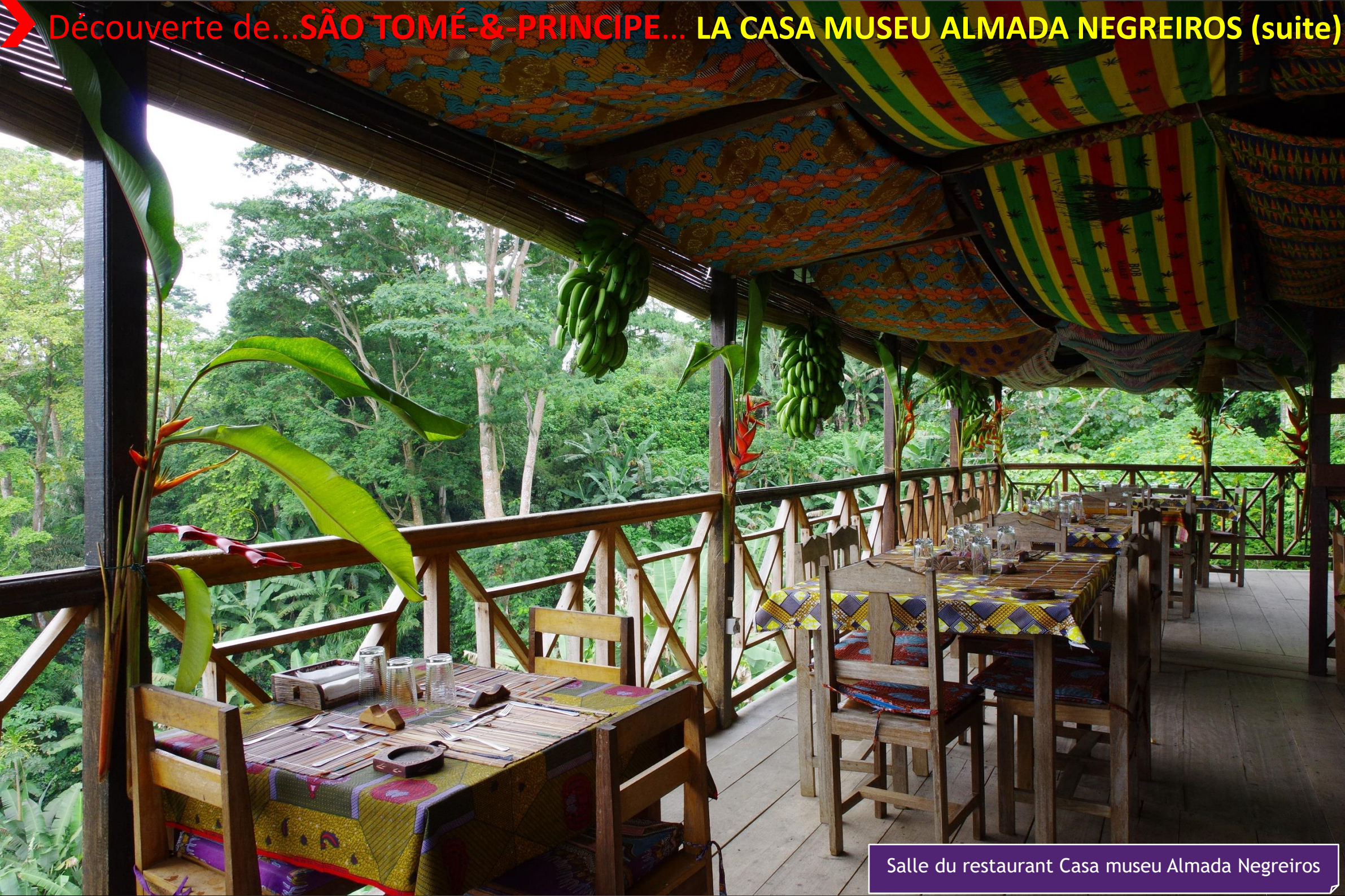
Salle du restaurant Casa museu Almada Negreiros