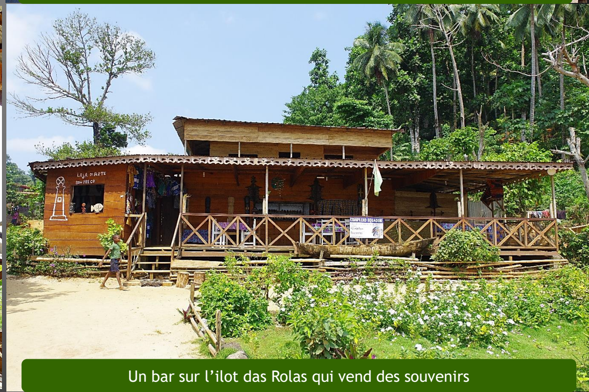
Un bar sur l'îlot das Rolas qui vend des souvenirs